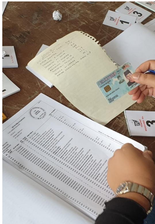
Gambar menunjukkan kerani barung SK Lubong Kulit mencatatkan nama dan nombor bilangan pengundi yang membuat semakan.

BERSIH 2.0 juga menerima aduan daripada orang awam bahawa kerani di barung di SK Lubong Kulit mencatat nama dan nombor bilangan setiap pengundi di kertas yang berasingan.