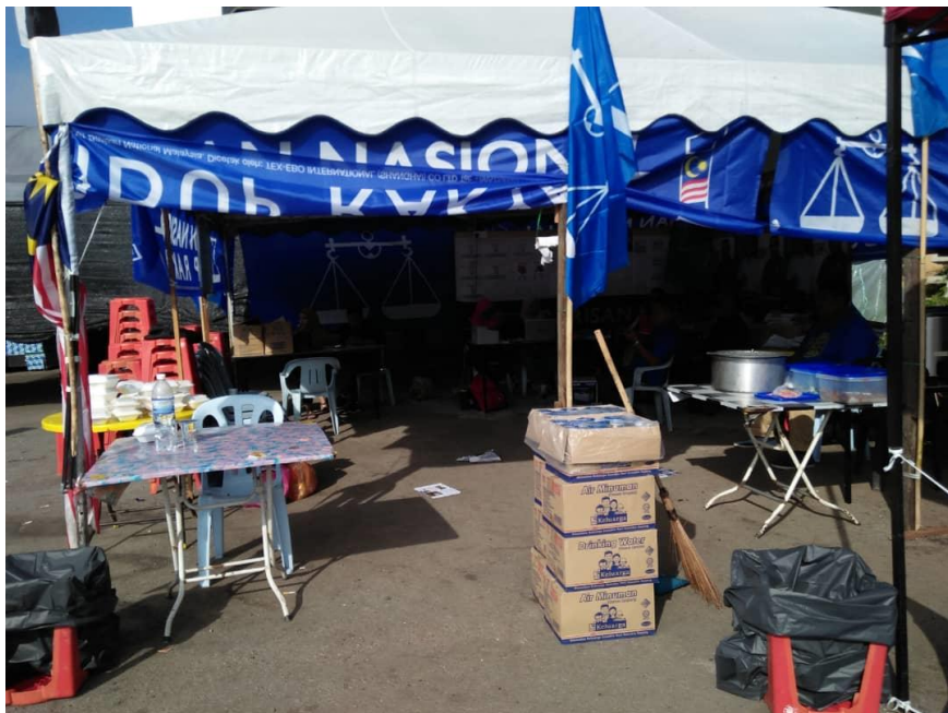
Gambar menunjukkan penjamuan makanan di luar SJKT Ringlet.

Makanan percuma diberi di pondok parti BN di luar pusat mengundi SJKC Kea Farm dan SJKT Ringlet.