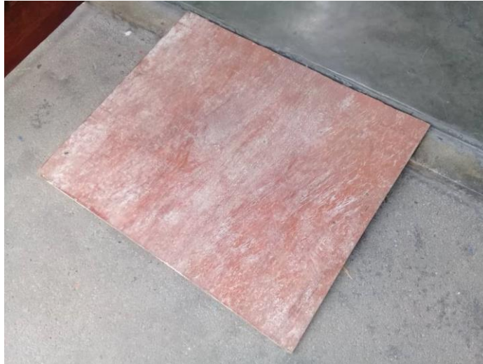
Gambar menunjukkan ramp di SJKC Kuala Terla.