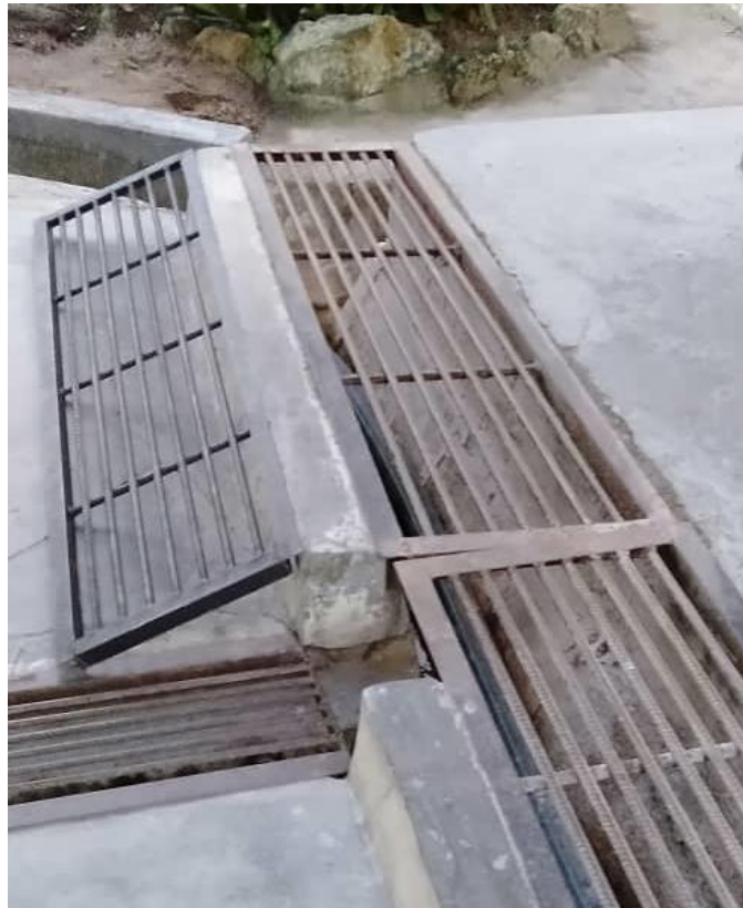
Gambar menunjukkan ramp di SJKC Kea Farm.